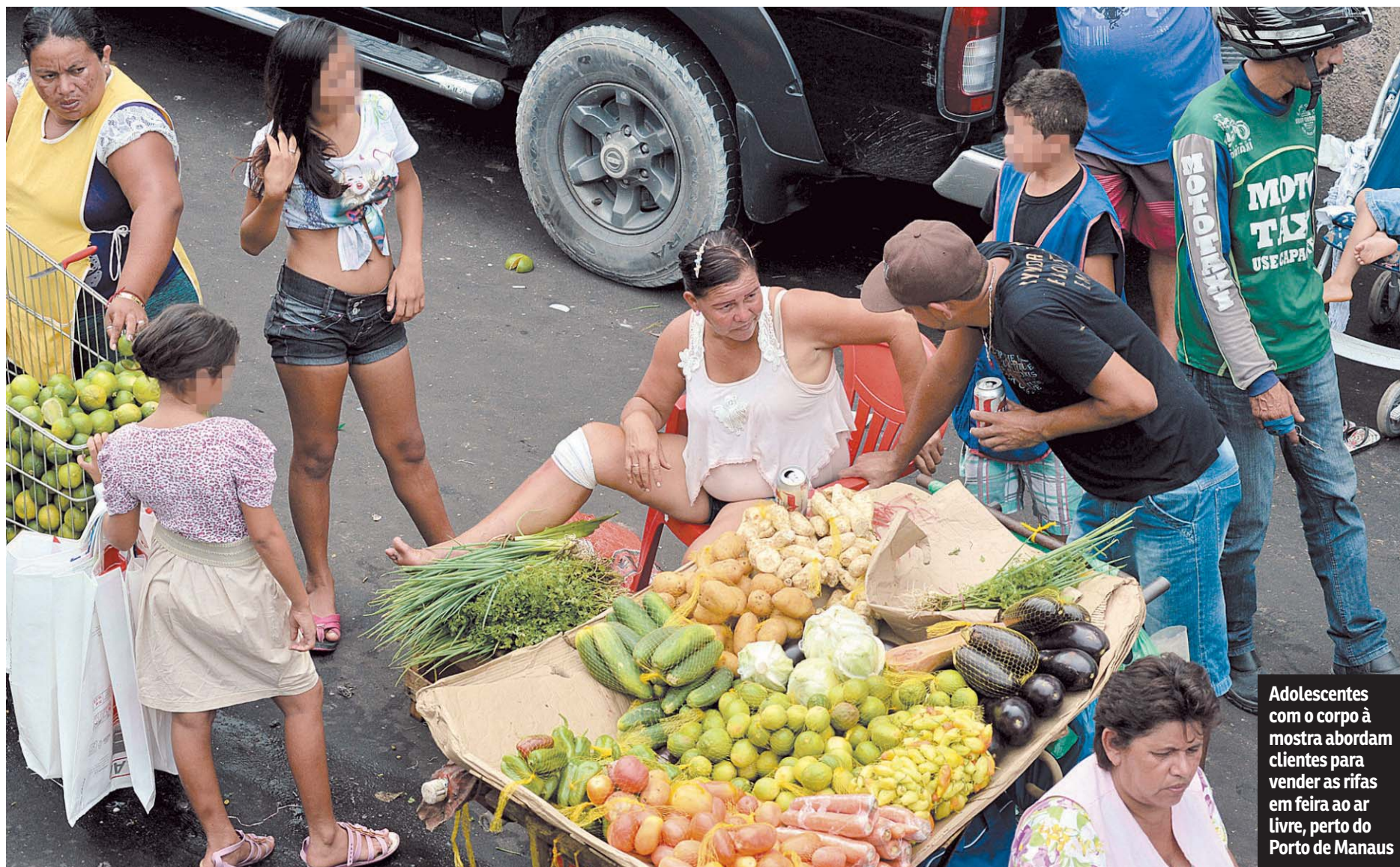
Adolescentes com o corpo à mostra abordam clientes para vender as rifas em feira ao ar livre, perto do Porto de Manaus

A Secretaria de Direitos Humanos da Presidência da República, em parceria com o Unicef e com o Centro de Defesa da Criança e do Adolescente da Bahia, desenvolveu um aplicativo chamado Proteja Brasil, que servirá para fazer denúncias de violações de direitos da infância, especialmente nos megaeventos. A partir da localização do autor da denúncia, é possível encontrar os telefones de entidades como conselhos tutelares e ONGs que ajudam no combate à violência contra a criança. As denúncias podem ser anônimas. É possível baixar o aplicativo gratuitamente em smartphones Android e iOS.