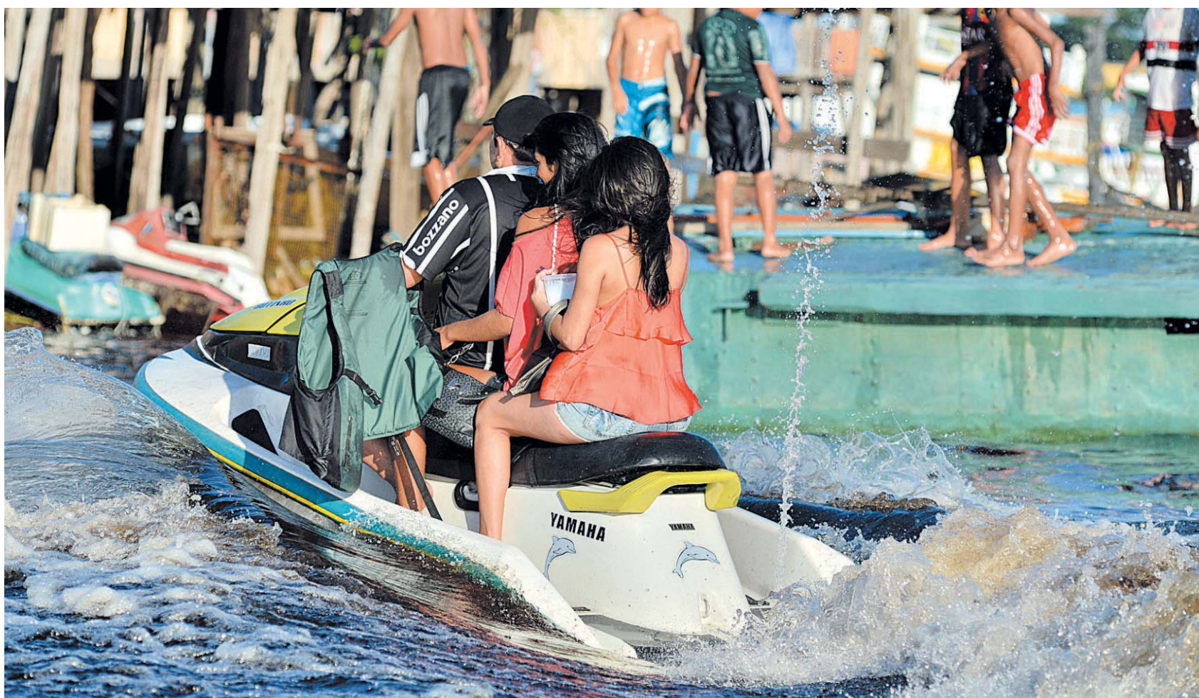
Em Manaus, homens transportam meninas em jet skis para levá-las a pontos de exploração sexual. Na capital baiana, meninos disputam as moedas atiradas por turistas estrangeiros: esmola utilizada para comprar crack

A socióloga e especialista em política públicas para infância Graça Gadelha percorreu as sedes da Copa. Reconhece que existe um esforço do governo para combater a exploração sexual, mas crítica a demora para o início das ações. “O país foi escolhido como sede da Copa em 2007, mas somente em 2012 o governo começou a elaborar a agenda de convergência. Foi uma decisão tardia”, comenta.